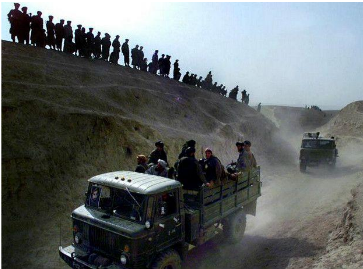
Image caption قندوز بیرون کند نیروهای انتلاف شمال در ۱۳۸۰ پیش از حمله امریکا این انتلاف نتوانست طالبان را از